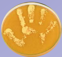
Handabklatsch ohne Seifenwaschung oder Desinfektion

Mit ihrer „Clean Care is Safer Care“-Initiative startete die WHO 2005 eine weltweite Kampagne für mehr Patientensicherheit. Im Mittelpunkt steht die Verbesserung der Händedesinfektion, da diese einen direkten Einfluss auf die Übertragung pathogener Erreger hat. Für dieses Ziel wurde das Konzept der „5 Momente der Händedesinfektion“ entwickelt (1).